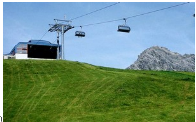
Bild: Tourismuswerbung Dalaas mit kaputter Landschaft

Außerdem ist er seit 2017 auch Landwirt, nämlich „Bergbauer“ und war von 2018 bis 2020 zudem Geschäftsführer der „Unser Dorfwirt Verwaltung GmbH“. Seit 2018 hat er eine Gewerbeberechtigung zum Betrieb des Restaurants Kristbergsaal, für das Jugend- und Ferienheim Wald, für den Schlepplift Hetzel und für den Schlepplift Dalaas – Paluda. ...