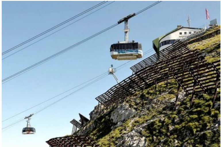
Bild: Tourismuswerbung Dalaas mit kaputter Landschaft

Er ist ehemaliger Bürgermeister der Brutaltourismus-Gemeinde Dalaas, ehemaliger Geschäftsführer der Klostertaler Bergbahnen Gesellschaft m.b.H. & Co. KG, ÖVP-Landesrat, zuständig u.a. für das Ressort „Tierschutz, Jagd und Fischerei“ – das ist in Vorarlberg ein- und dasselbe Ressort, Präsidiumsmitglied der ÖVP-Vorarlberg, Landesvorstand im Bauernbund, Landesvorstand im ÖAAB, Parteiohmann der ÖVP-Dalaas, Aufsichtsratsvorsitzender Vorarlberg Tourismus GmbH, ...