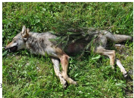
Bild. Erschossener Wolf in Salzburg, Juli 2023

Die illegale Verordnung wurde in Salzburg im Juni erlassen und im Juli 2023 wurde ein Wolf erschossen. Der Kadaver wurde dem Jäger als Trophäe überlassen.