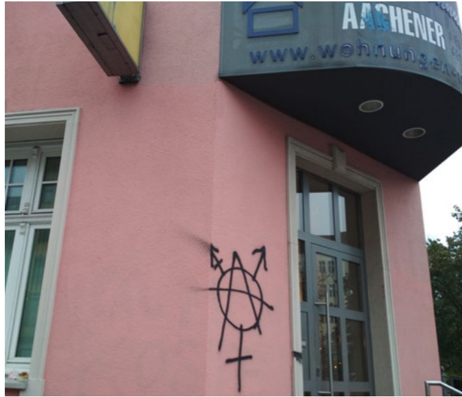
Die Fußnoten zum Text findet ihr in der Originalversion: de.indymedia.org/node/35141