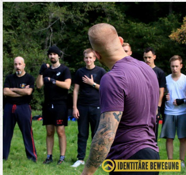
Abbildung 8: Bild mit völkischem Tattoo vom IB Aktivistenwochenende Oktober 2019 [47]

Die gleiche Person war auch auf der gescheiterten IB-Demonstration in Halle im Juli 2019 anwesend.[48]