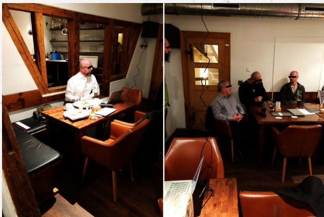
Abbildung 11: Uniter e.V. im Restaurant Zur Zill [89]

Mittlerweile hat der Verfassungsschutz Uniter zum Prüffall erklärt. Die Gemeinnützigkeit wurde ihnen vom Finanzamt Stuttgart entzogen. Der Verein hat seinen Sitz nun in der Schweiz.[94]