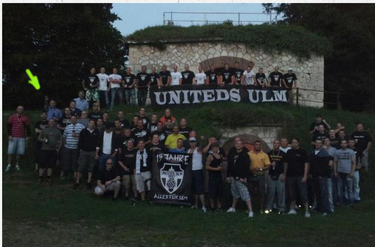
Abbildung 3: Uniteds Ulm mit Hitlergruß[20]

Außerdem war das Uniteds -Mitglied Robert H. laut einem Datenleak beim Onlineshop OPOS Records Kunde und gab dabei die Emailadresse „UnitedsUlm@web.de“ an.[31] OPOS Records vertreibt bis heute extrem rechte Musik im Genre NS-Hardcore, die Kampfsportmarke Greifvogel Wear und die Marke One Family . Die Label zählen zu Erkennungszeichen der Naziszene. OPOS Records unterstützt aktiv Neonazi-