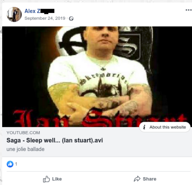
Abbildung 5: Post von einem Song über Ian Stuart [20]

Auch von der Donau Crew zeigen einige Mitglieder offen Sympathien für extrem rechte Inhalte und tragen szenetypische Marken wie Thor Steinar . Ein Mitglied postet Inhalte über Ian Stuart, Sänger der extrem rechten Band Skrewdriver in den 1990er Jahren und Begründer von Blood and Honor , ein mittlerweile verbotenes extrem rechtes Netzwerk. Ian Stuart ist eine bis heute eine in der Neonaziszene zelebrierte Person. Siehe Abb. 5