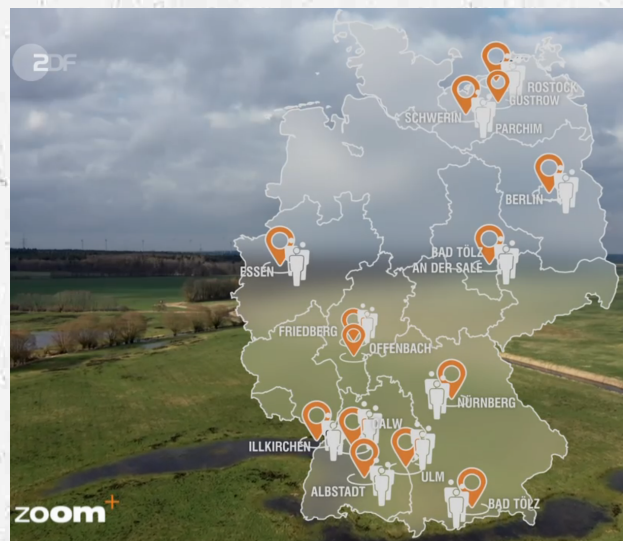
Abbildung 10: „Hannibal“-Netzwerk [88]