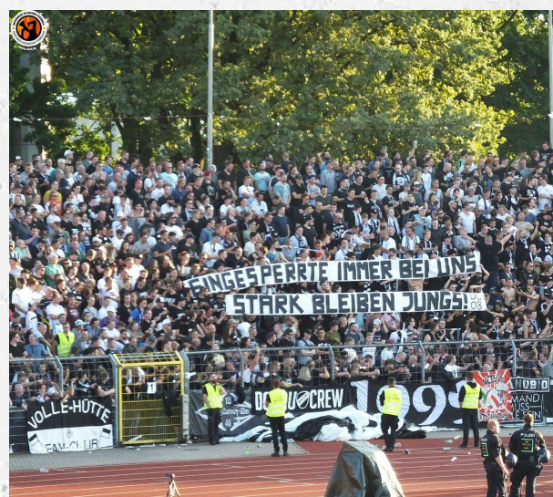
Abbildung 1: Banner Donau Crew [13]