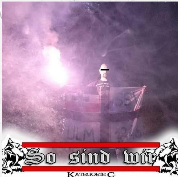
Abbildung 2: SSV-Hool [20]

Der Angriff in Erbach-Dellmensingen reiht sich ein in mehrere extrem rechts motivierte Taten und Vorfälle, die seit Jahren in Zusammenhang mit der SSV-Fanszene stehen.