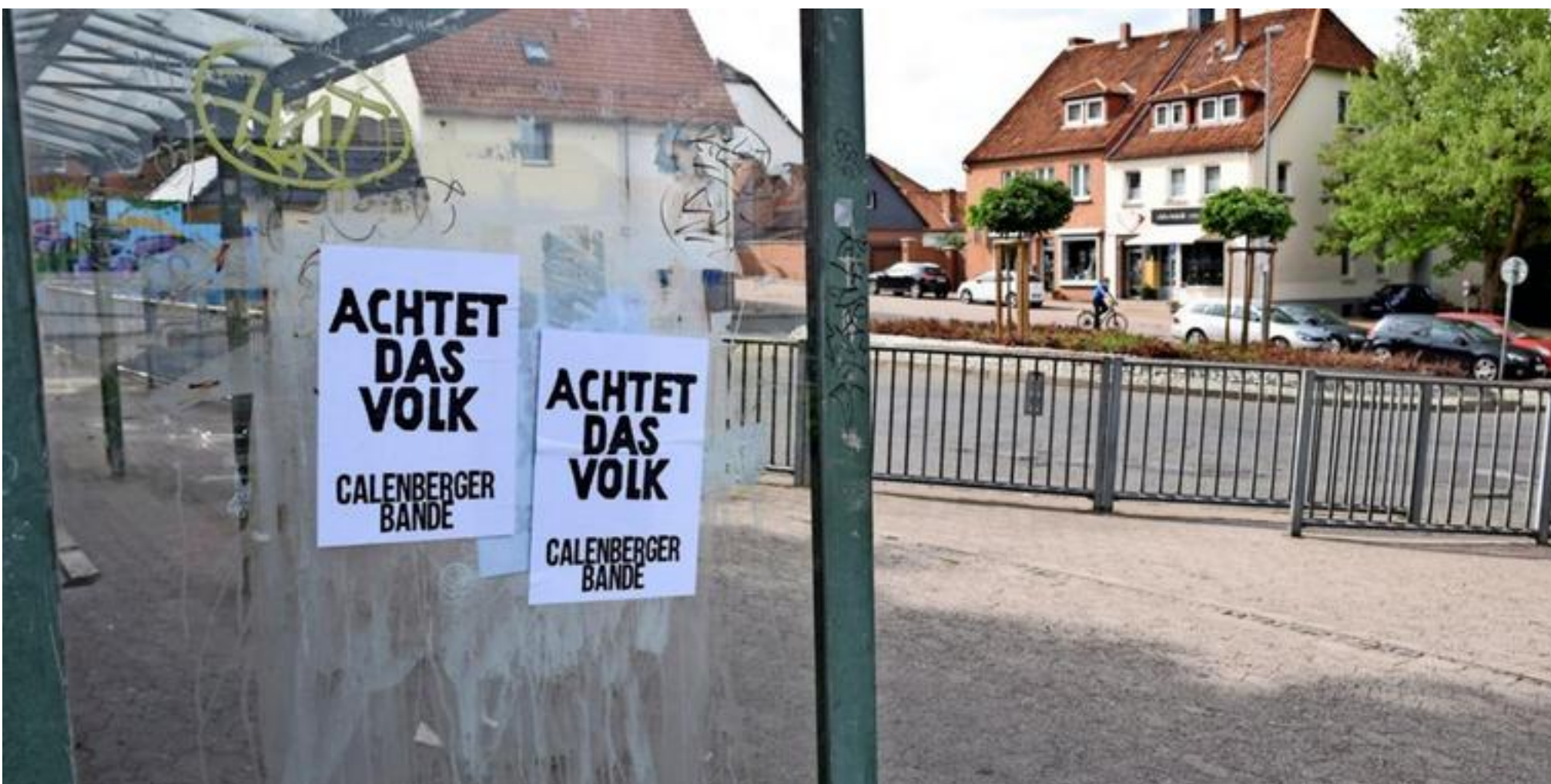
Diese Aufkleber sind Anfang August rund um die Buswendeschleife in Ronnenberg aufgetaucht.

Es ist der bisherige Höhepunkt rechtsextremer Umtriebe in Ronnenberg und Gehrden: Eine „Calenberger Bande“ ruft mit Flugblättern zu teils ausländerfeindlichen Aktionen auf. Auch Bürger fanden die Flyer in ihren Briefkästen. Zu den Ermittlungen wurden jetzt hannoversche Polizisten hinzugezogen.