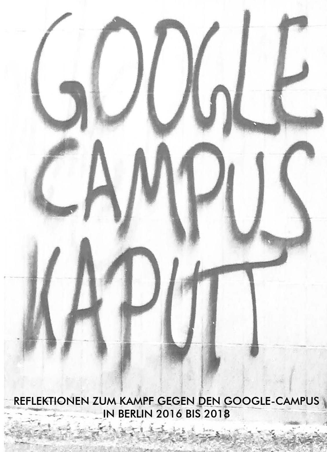
REFLEKTIONEN ZUM KAMPF GEGEN DEN GOOGLE-CAMPUS IN BERLIN 2016 BIS 2018