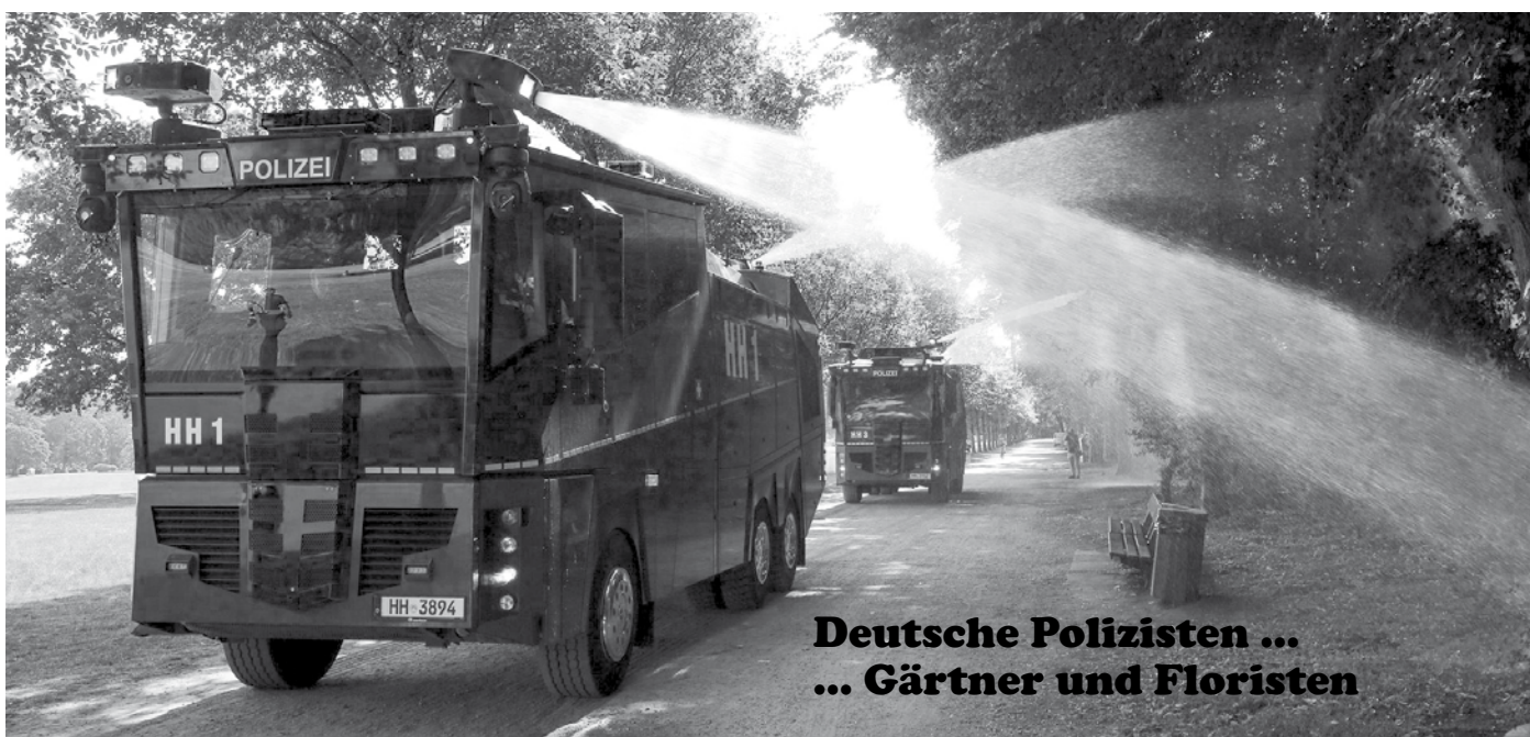
Deutsche Polizisten ... ... Gärtner und Floristen